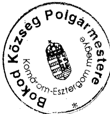
Szöllősi Miklós Polgármester